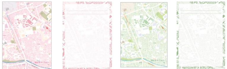
▲“現代編”(左)、“過去編”(右)の表紙と中紙

A6 サイズ 80 枚のメモ帳。表紙とともに、中紙にも地図を薄くあしらいました。