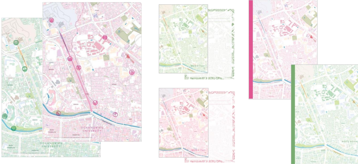
(左から)クリアファイル、メモ帳、ノート

お茶の水女子大学と株式会社ゼンリンは、この度、産学連携の取り組みとして、本学の人文科学科地理学コースに所属する学生による有志グループ「地理女子」と、ゼンリンの社員により、お茶の水女子大学周辺の地理ネタを盛り込んだ文房具を共同で企画しました。