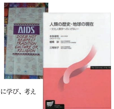
出典 ■『人類の歴史・地球の現在』放送大学教育振興会(2007)

This class offers a foundation to discuss the complex relationships of gender, locality and globalization from the viewpoint of socio-cultural anthropology.