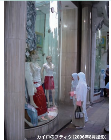
カイロのブティック (2006年8月撮影)

Our goal is to understand the relation between Islam and gender in the global era when the veiling of Muslim women has become a crucial world issue, paying attention to comparative and historical perspectives.