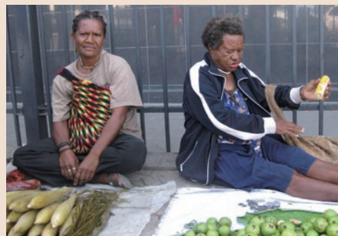
ポートモレスビーの街路で取締りの目を気にしながら商売する女性たち

In this course, we review major perspectives in Gender and Development (GAD) and scrutinize them with local sensitivities.